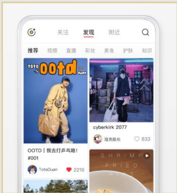
小红书APP界面与生成效果预览

一站式生成小红书图文内容（选题+文案+配图），通过AI智能赋能，高效打造爆款笔记，精准触达潜在客户群体，实现低成本、高转化的获客目标。